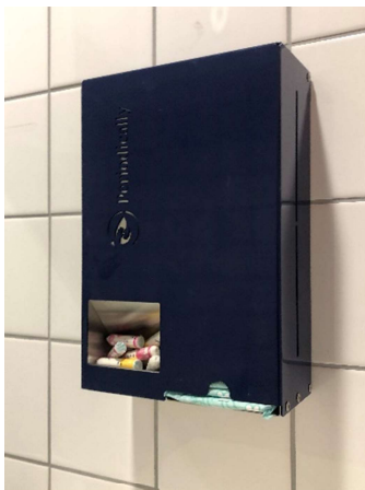
der neue Periodenartikelspender auf der Mädchentoilette

Zusätzlich hat ein von uns organisierter Berliner-Verkauf stattgefunden, um den Tag der Schülerinnen und Schülern noch ein wenig mehr zu versüßen.